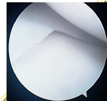
Immagine artroscopica di un menisco

Sebbene quasi tutte le articolazioni possano essere trattate per via artroscopica, quelle che più frequentemente vengono sottoposte a questo tipo di chirurgia sono il ginocchio , la spalla e la caviglia .