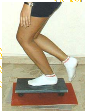
Esercizi di ginnastica propriocettiva