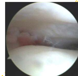
Immagine artroscopica di una caviglia

possano essere trattate per via artroscopica, quelle che più frequentemente vengono sottoposte a questo tipo di chirurgia sono il ginocchio, la spalla e la caviglia.